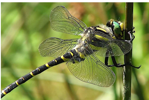
Figure 2.5 Cordulegaster b. boltonii , une espèce qui n'est pas rare autour des ruisselets.