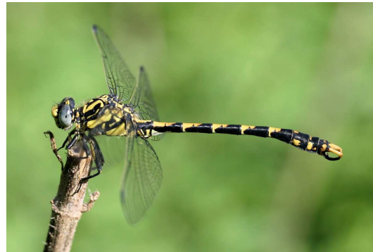
Figure 2.4 Onychogomphus uncatus se reproduit dans le Liort, mais les adultes fréquentent toute la vallée.