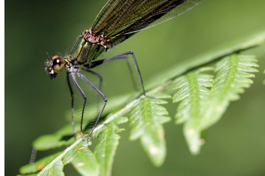
Figure 2.2 Calopteryx virgo meridionalis ; probablement l'espèce la plus répandue dans la vallée du Liort.