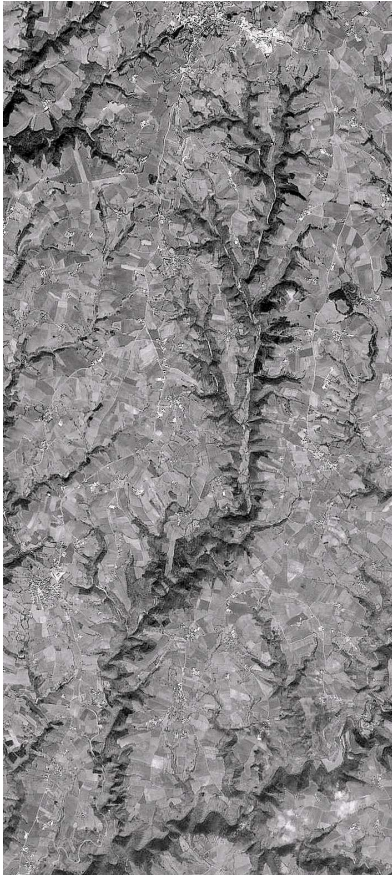
Figure 1. La vallée du Liort ; les plateaux intensivement cultivés se distinguent clairement de la vallée couverte de forêts. Le bassin-versant est limité par des routes (assez peu visibles) parallèles au Liort.

nombreuses vallées se trouvent souvent dans des conditions plus naturelles avec des forêts et des prairies humides exploitées de manière plus extensives (NOORDIJK, 2003). Ces types d'occupation de l'espace régulent la qualité des eaux courantes et le ruissellement, assurant en conséquence les conditions nécessaires à l'expression de la biodiversité aquatique.