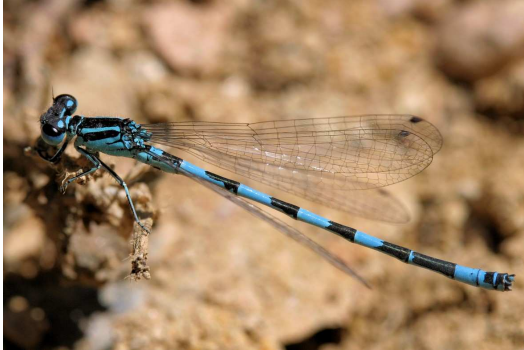
Figure 2.1 Coenagrion mercuriale , espèce présente en annexe II de la directive "Habitats" de l'Union européenne, a été trouvé sur plusieurs des ruisselets.