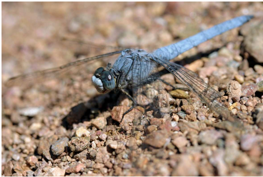
Figure 2.3 Orthetrum brunneum est abondant sur les ruisselets des plateaux.